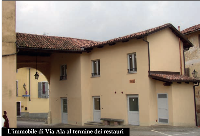
L'immobile di Via Ala al termine dei restauri

Per quanto riguarda il progetto Crossing Roero a Sommariva Perno, attivato all'interno del più articolato "progetto giovani" annuale con la preziosa collaborazione della cooperativa Lunetica di Bra, si sono svolti incontri settimanali ogni giovedì sera a partire da ottobre. In questi incontri, finalizzati alla coesione dei ragazzi e alla formazione del gruppo, i giovani assidui partecipanti hanno avuto modo di ragionare e riflettere su alcune tematiche molto importanti quali la politica, il futuro, l'impegno civico e la cittadi-