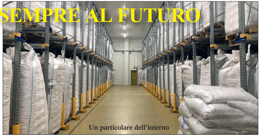
Un particolare dell'interno