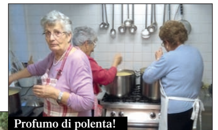
Profumo di polenta!

menu roerino che prevedeva la grande polenta ottenuta con la favolosa farina "otto file", macinata a pietra dal Molino Rosso di Cornelianò, la salciccia di Bra, il coniglio con i peperoni del Roero e l'immancabile merluzzo con cipolle, preceduto da una carrellata di antipasti tipici come pèss 'd còj , peperoni arrostiti con salsa di tonno, acciughe al verde e insalata russa, seguiti da formaggi piemontesi con cugnà e da una bella scelta di dolci a base di pere madernassa e torte di noccioline con zabaglione. Inutile dire che tutto questo ben di Dio, innaffiato dai migliori vini del Roero e di Langa, è stato molto apprezzato dai padroni di casa tedeschi. Una bella serata di promozione del territorio grazie alla disponibilità delle cuoche sommarivesi, che hanno ricevuto i grazie sinceri e gli apprezzamenti degli organizzatori e soprattutto dei... commensali.