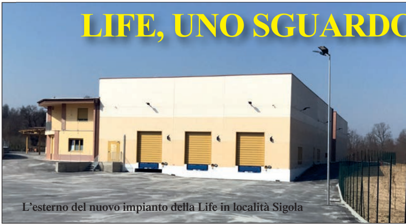
L'esterno del nuovo impianto della Life in località Sigola