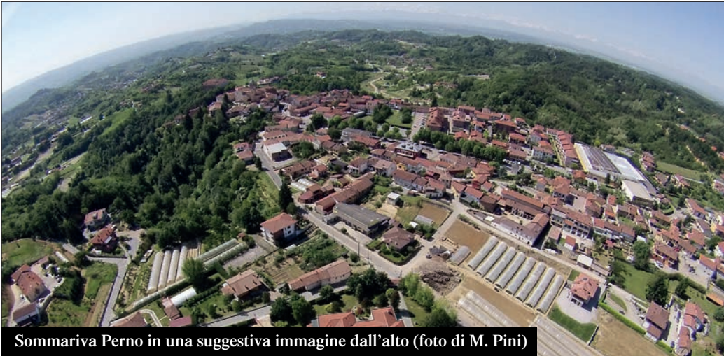
Sommariva Perno in una suggestiva immagine dall'alto

La popolazione di Sommariva Perno continua a diminuire, anche se meno rispetto al 2015. Lo documentano i dati dell'anagrafe al 31 dicembre 2016. Sono infatti sei gli abitanti in meno rispetto al 2015, che vanno ad aggiungersi ai 24 dell'anno precedente e ai 37 del