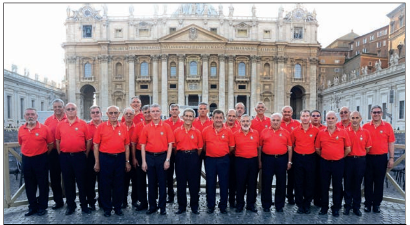
Il Coro Stella Alpina davanti alla basilica di S. Pietro, dove ha cantato nel 2016

Sabato 6 maggio , poi, è in programma un Omaggio ad Ennio Morricone : il maestro Andrea Albertini e il suo Quintetto eseguiranno le colonne sonore più famose del grande compositore, con proiezione di scene significative dei relativi film. Una serata da non perdere assolutamente. Sabato 27 maggio la Compagnia Il nostro teatro di Sinio , nel corso della Sagra della Fragola, metterà in scena Strì , l'ultima divertente commedia dialettale scritta e interpretata da Oscar Barile. Domenica 25 giugno una chicca attende gli appassionati di musica: l' Orchestra Salassese , composta da oltre 50 elementi, eseguirà Musica sotto il campanile , un concerto di alto livello, previsto in Piazza Montfrin (nella Parrocchiale in caso