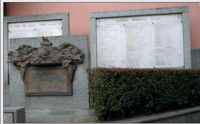
Il monumento ai Caduti in Piazza Marconi